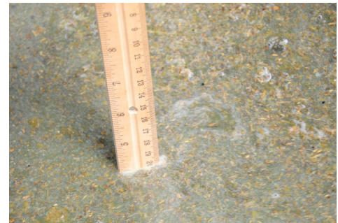
la solución del baño de patas debidamente mantenida debe mantenerse a una profundidad de cuatro pulgadas.

Los baños de patas deben tener un mínimo de 10 pies de largo por lo que cada vaca pisa el baño dos veces con cada pezuña. La profundidad de la solución debe mantenerse a un mínimo de cuatro pulgadas, de manera que los espolones queden sumergidos a medida que la vaca